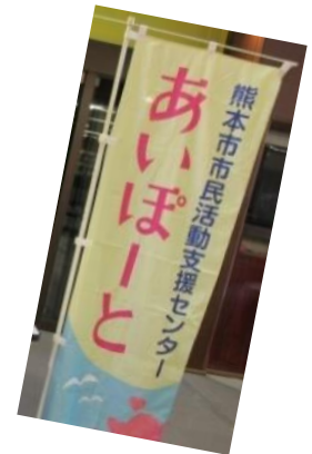
このぼりが目印です！

なかなか「あいぽーと」まで足を運べない方！お近くの方！この機会をご活用ください♪