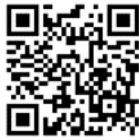
受付 Google フォーム