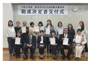
ステップアップ助成採択団体