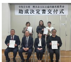
スタートアップ助成採択団体