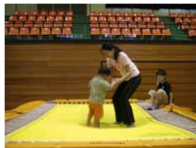
こんなにちっちゃな子どもさんもチャレンジ！！