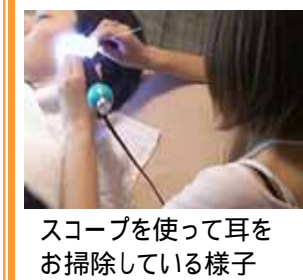
スコープを使って耳をお掃除している様子