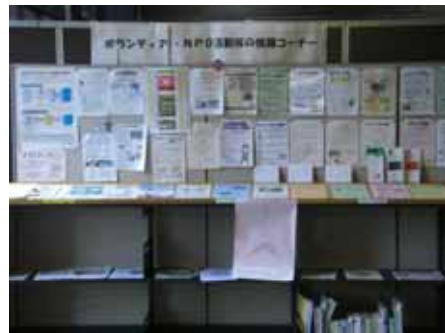
チラシやパンフレットを設置しているコーナー

☕ ここでちょっとブレイクタイム ☕ ここでちょっとブレイクタイム ☕ ここでちょっとブレイクタイム ☕