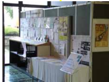
全体はこんな様子

熊本市役所の1階(国民年金課前スペース)にボランティア募集情報や養成講座のチラシやパンフレット等が設置してあります。 市役所にお越しの際は、お立ち寄り、ご利用ください。