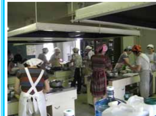
献立にそってお料理をしている様子