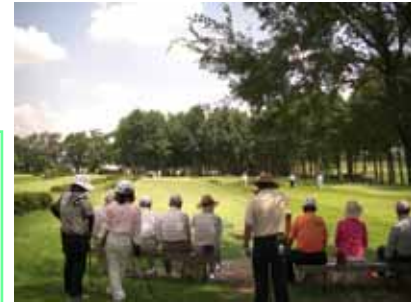
とろもよびのんびり日和になりました！

今まで以上に、多くの方にパークゴルフに参加いただき、親・子・孫の3世代交流の大会が出来たらと思います。 また市外・県外の方たちとの交流ができるような、大きな大会を熊本市内で開催できたらとも考えています。 パークゴルフを始めて、「体調が良くなった」「気分が明るくなった」など、多くのご意見を聞きます。是非一度、パークゴルフを体験していただき、楽しさを実感いただければと思います。