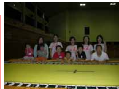
トランポリンクラブUDさんの皆さん