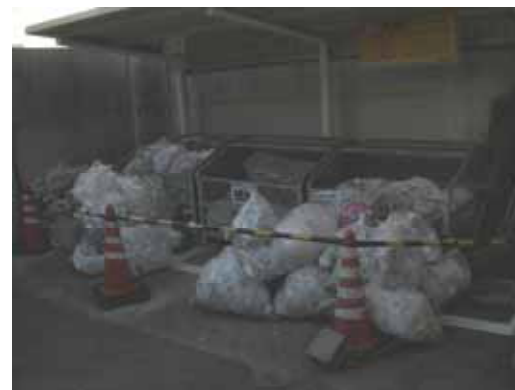
こんなにたくさんのゴミが集まりました！1時間くらいの清掃でこれだけ集まるとはスゴイ！！

「早朝から汗をかきながら街がきれいになっていく様子を実感することができたので、参加してよかったです。」 「ゴミ箱のある付近には特にゴミがあふれていていましたが、みんなで片づけてきれいになり、気持ちいい汗をかきました。」