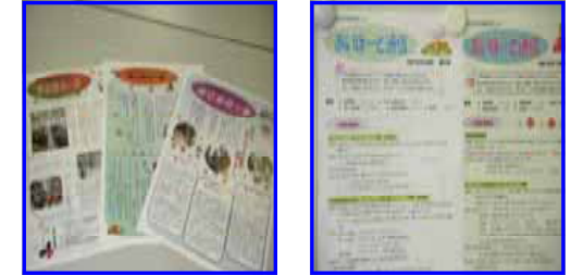
はじめての一步 (年4回発行)