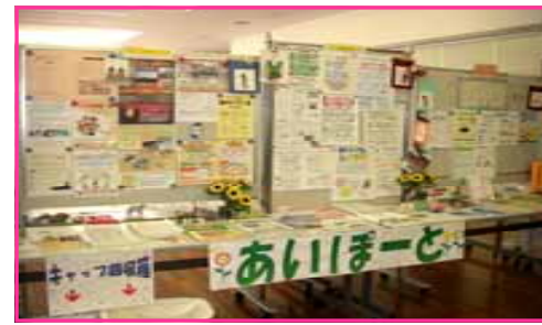
ボランティア・NPOなどの情報設置コーナー