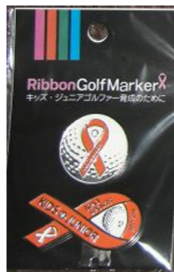
キッズ・ジュニアゴルファー支援ゴルフマーカー

最近の子どもたちは野球の経験がなく、誰でも体験できるニュースポーツとして「ティーボール」の普及のために団体を立ち上げました。現在では、キッズ・ジュニアのスポーツ振興・青少年育成のためプロゴルファーによるゴルフ教室、目の不自由な皆さんのためのブラインドゴルフ大会の実施や、総合スポーツクラブの支援のほか、コーヒー・紅茶の美味しい入れ方教室、JALの元添乗員による歩き方教室などの生活の質の向上に寄与するための文化セミナーも行っています。