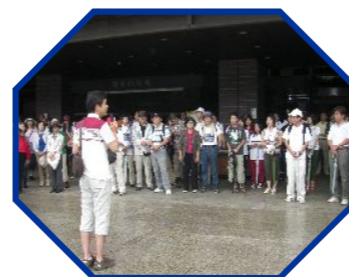
昨年の2倍にのぼる参加者が集まりました。

今年で第4回を迎えた「火の国まつり総踊り」後の街なか清掃を8月9日(日)に実施いたしました。今年も、幸山市長をはじめ219名のボランティアの方が参加され、70ℓのゴミ袋18袋分のゴミの量を回収できました。これは昨年より8袋分減り、市民のマナー向上が見られました。来年も多くの方に参加していただき街なかの美化に貢献していきたいと思っております。参加していただいたみなさま、本当にありがとうございました。