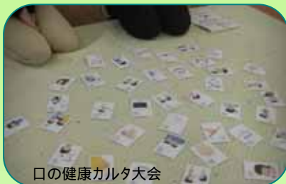
口の健康カルタ大会