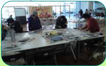
エコバッグづくり [ユースかんくま]