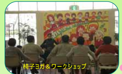
椅子ヨガ&ワークショップ