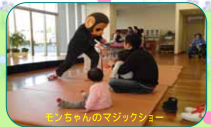
モンちゃんのマジックショー