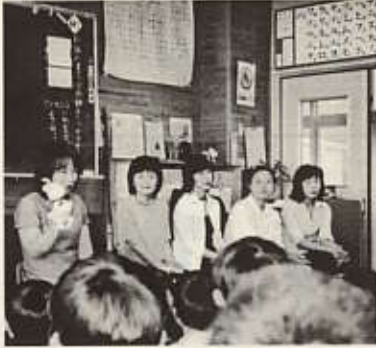
人形を使つての語り