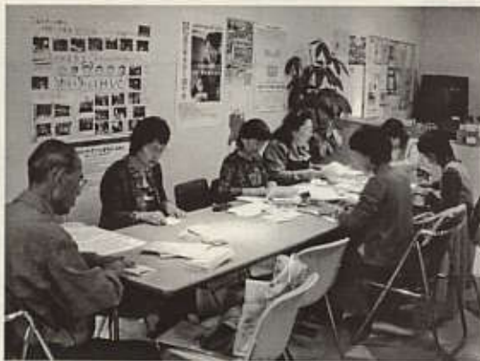
クリスマス会 準備風景

団体についての詳しい情報については、ボランティア活動推進コーナーまでお問い合わせください。