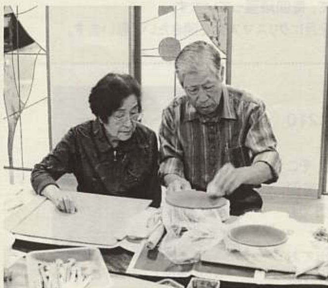
陶芸ボランティア